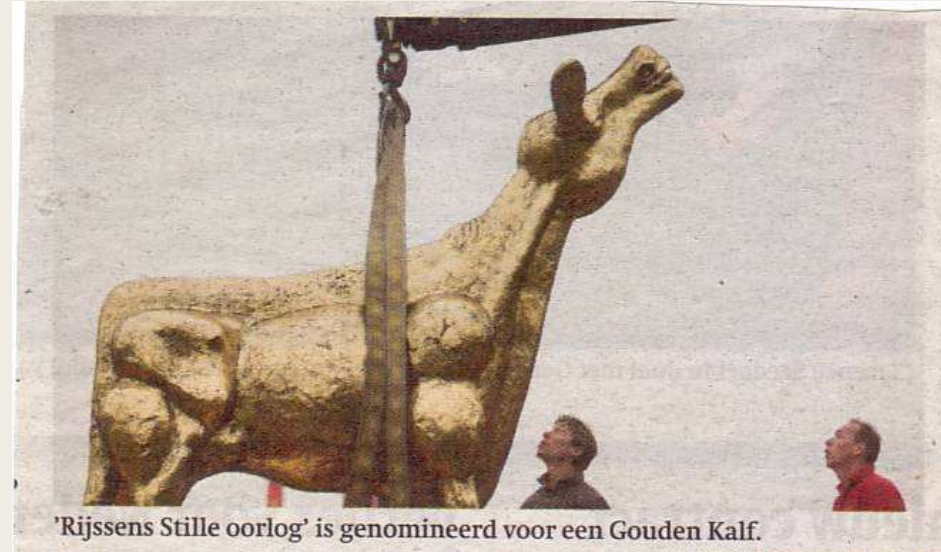
'Rijssens Stille oorlog' is genomineerd voor een Gouden Kalf.

'Staphorst heeft de naam, maar in Rijssen gebeurt het'